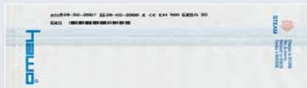
hm 3020 DC-V: Siegelbare Klarsichtbeutel mit zweizeiligem Aufdruck und Barcode Sterile goods pouch with double-line printout and barcode