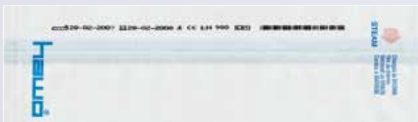
hm 3010 DC-V/DC-VI: Sterilgutbeutel mit einzeiligem Aufdruck und Barcode Sterile goods pouch with single-line printout and barcode

SAFETY: The validation of packaging processes is crucial to ensure that sterile barrier system integrity is attained and will remain so until opened by the users of sterile medical devices. The process parameters temperature, contact pressure and sealing speed are controlled, monitored, recorded and represented on the TFT-screen directly by the devices. The devices fulfil all necessary requirements for process validation according to EN ISO 11607-2:2006, the therefrom resulting specifications of the German Society for Sterile Supply (DGSV) detailed in the 'Guideline for the Validation of the Sealing Process' as well as the RKI Guidelines (Robert Koch Institute). 1