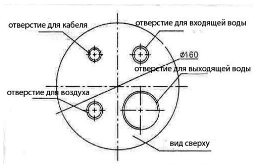
Рис. №1 Вид сверху