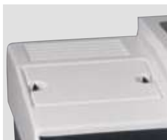
WP-Ex 3000 и WP-Ex 2000