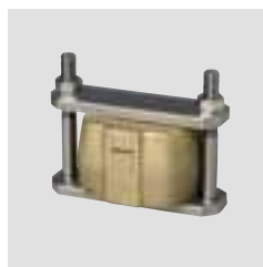
Универсальный зажим для кювет