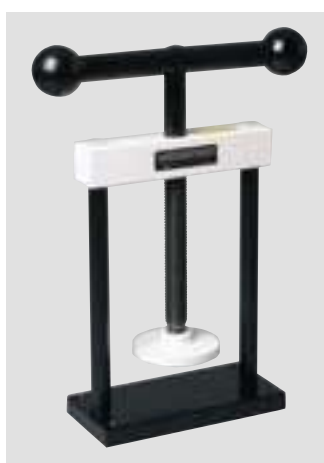
Стальной пресс на 1-3 кюветы