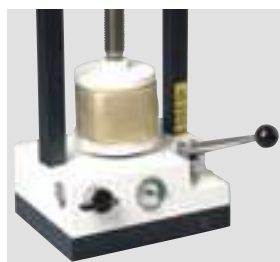
WW-33 на 1-3 кюветы